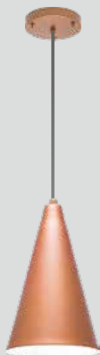
pendente NIÊ 5