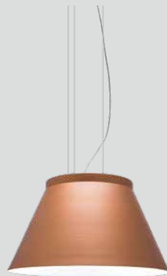
pendente NIÊ 2