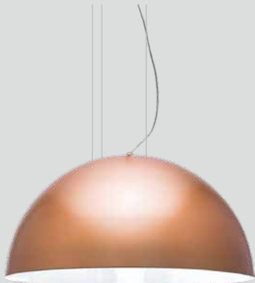
pendente NIÊ 1/20

Design volumoso, simplicidade de seus elementos em formas puras e geométricas. Pendentes elaborados em chapa de alumínio, nas cores preto, branco, prata, cobre, tabaco ou dourado.