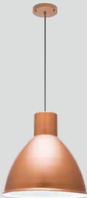
pendente NIÊ 3