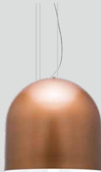
pendente NIÊ 1/40