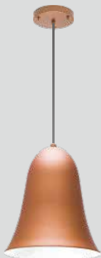
pendente NIÊ 4