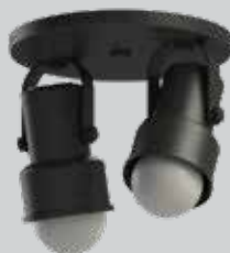
spot INVAL 01/2