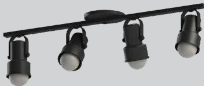
spot INVAL 04