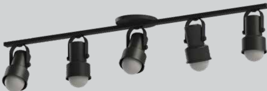
spot INVAL 05