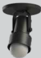
spot INVAL 01