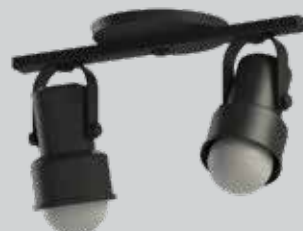
spot INVAL 02