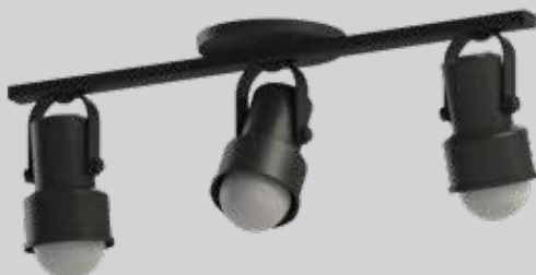
spot INVAL 03